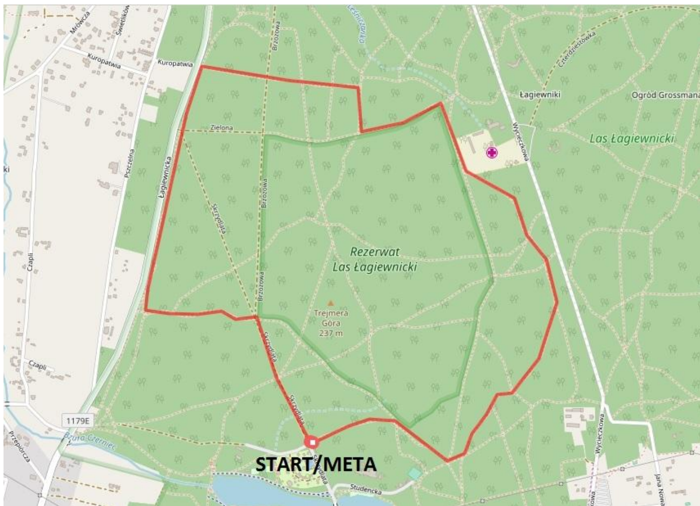
Mapka biegu głównego (pętla 5km)